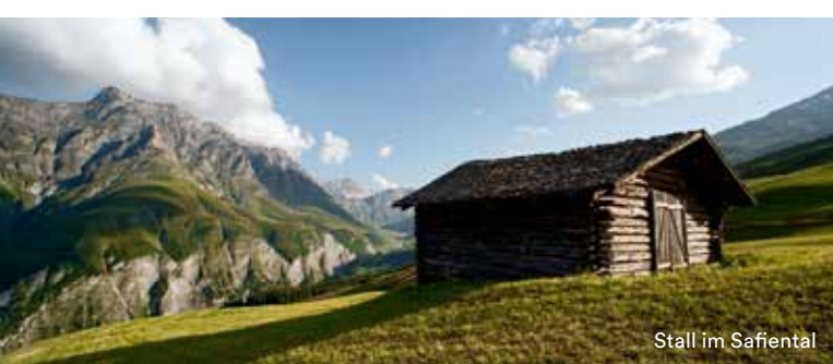
Stall im Safiental