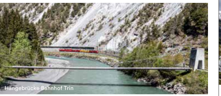
Hängebrücke Bahnhof Trin

Die Holzhängenbrücke in Trin ist eine von drei Übergängen in der Rheinschlucht. Mit einer Länge von 105 Meter und einer Gehbreite von 1.8 Meter gehört sie zu den längsten in Graubünden.