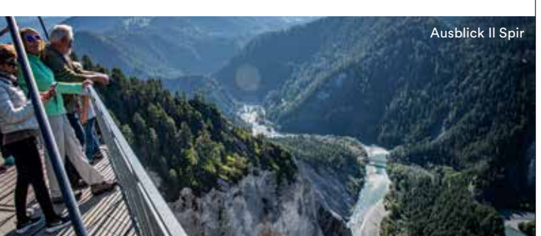
Ausblick Il Spir

Wackenaus Die Aussichtsplattform «Wackenaus» liegt am Ende der massiven Rheinschlucht und ist von Trin Bahnhof über die Wanderroute 656.4 oder von Bonaduz über die Route 656.7 gut zugänglich.